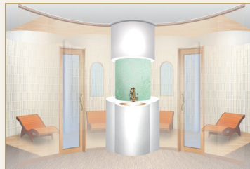
足を伸ばしてゆっくりできるサウナルーム