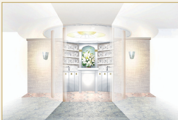
ロッカー、アクア、施術をつなぐタオルハブ

西洋文化の視点で、遠く東洋に思いを馳せる羨望の神秘、憧憬をあつらえとして表現し、東洋で重用される宝玉の力として「翡翠」をテーマとし、アクセントカラーに使用しています。