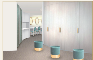
メイク製品を完備したロッカールーム

< 四条の真ん中にいるとは思えない、ゆっくりと静かな時間をお過ごしいただける空間です >